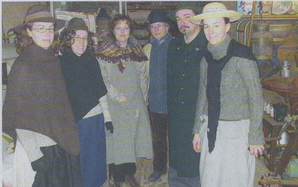
Les bénévoles font régulièrement des animations, en costume d'époque.

« C'est le cas d'un tour à bois de 1850 qui servait à fabriquer les ébauches des moyeux