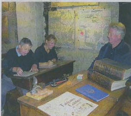
Odeur de craie et d'encre : un tour par la classe pour retrouver son âme d'enfant.