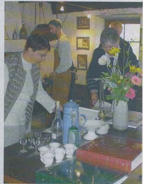
Toutes sortes d'objets anciens qui faisaient partie de la vie quotidienne sont présentés.

des années 1940 sera présentée au public qui pourra retrouver son âme d'enfants. Dans ce petit musée, un espace est dédié à l'activité principale des femmes à domicile : la confection des gants pour la ganterie Tréfousse qui ont employé jusqu'à 6 000 personnes en Haute Marne au temps de leur prospérité. Dans les vitrines, des registres de l'époque et quelques modèles de gants sont exposés, une paire de gants a d'ailleurs été retrouvée et achetée aux Etats-Unis grâce à Internet.