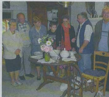
Les visites sont toujours un moment de partage.

➤ Visites gratuites tous les dimanches de 15 h à 18 h du 27 juin au 19 septembre 2010. Toute l'année pour les groupes ou scolaires sur rendez vous, en téléphonant au 03.25.31.99.70. Entrée gratuite.