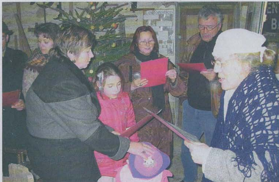
Noël, un moment privilégié pour redécouvrir les traditions...