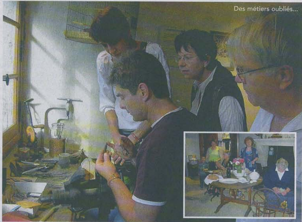
Des métiers oubliés...

Sur les murs, les cartes de géographie et les photos de classe replongeront les visiteurs au temps de leur jeunesse. A compter de cette année une exposition de jouets