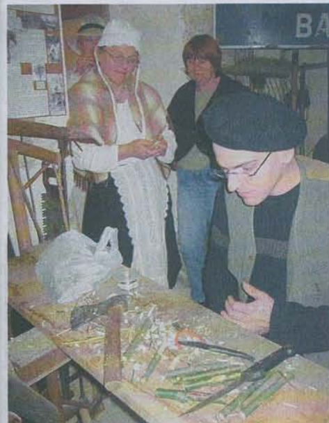
Comme "dans le temps"...

Installé au cœur d'une ferme traditionnelle, le musée La Ferme d'antan invite les visiteurs à remonter le temps, pour revivre la campagne champenoise des années 1850. Grâce à un couple de passionnés, ce lieu perpétue la mémoire de nos aïeux, qui se retrouvent en ce lieu, pour un arrêt sur image au cœur du XIX e siècle.